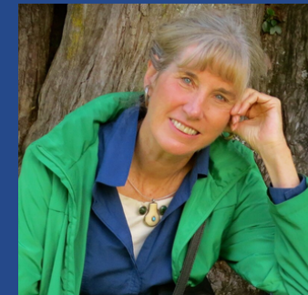
Sarah Blaffer Hrdy

Primatologue et anthropologue américaine, Sarah Blaffer Hrdy a longuement travaillé sur la maternité. En 2024, elle sort son ouvrage Le temps des pères , dans lequel elle s'intéresse cette fois-ci à la paternité. Une réalisation sur laquelle se base le documentaire Paternité - Une métamorphose décryptée .