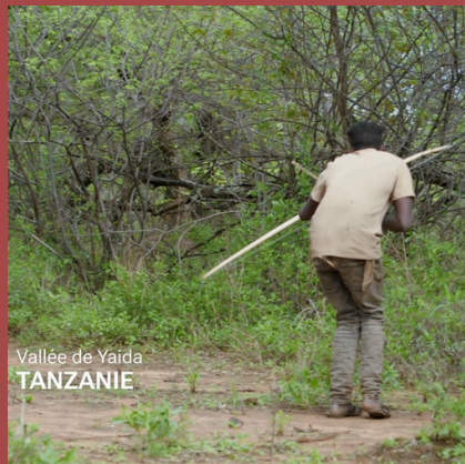
Vallée de Yaida TANZANIE