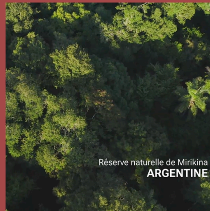
Réserve naturelle de Mirikina ARGENTINE